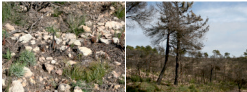
Figura 1. Rebrote de matorral y especies arbóreas ocho meses después del incendio de Navalón (Valencia, 2008).

laderas, el cuidado de los caminos o la limpieza del bosque. Todo esto, unido a la presión turística, a la expansión de las zonas urbanas y a otras causas de índole social, conllevó a un gran incremento en el número y daños causados por los incendios forestales durante las décadas de 1960, 1970 y 1980. A partir de 1990, el número de incendios forestales ha aumentado progresivamente, aunque afectando a una menor superficie total anual.