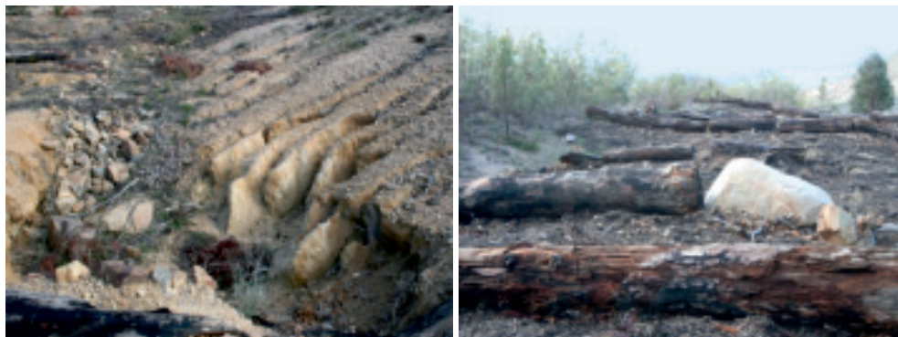
Figura 2. A la derecha, efecto de la erosión acelerada tras el incendio de Canberra (Australia, 2003). A la derecha, aplicación de estrategias de control de la erosión en el área afectada en la actualidad.

Una buena gestión forestal debe basarse en la investigación científica. Respecto a los incendios forestales, se han invertido muchos recursos en apagarlos, pocos en prevenirlos, y escasos en el estudio de su impacto sobre suelos, aguas y vegetación. El conocimiento de los efectos del fuego sobre las propiedades de los suelos y la determinación y utilización de índices de impacto se convierte en esencial a la hora de llevar a cabo decisiones sobre el manejo, la restauración o la prevención de las zonas afectadas por el fuego.