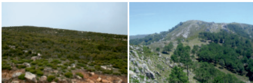
Figura 3. Vistas de la Sierra del Algibe (Cádiz). A la derecha, brezal de cumbre, un tipo de vegetación cuya distribución se halla estrechamente relacionada con la recurrencia del fuego; fotografía: Lorena M. Zavala. A la izquierda, laderas degradadas y reforestadas con pinar; fotografía: Antonio Jordán.

La comunidad científica, los organismos responsables de la toma de decisiones, y la sociedad deben ser capaces de proponer y utilizar métodos de evaluación de los impactos del fuego sobre los ecosistemas. A pesar de la abundante información existente en la literatura científica sobre el tema, el suelo suele ser el gran olvidado a la hora de prevenir y restaurar zonas afectadas por incendios. Pero por alguna razón, no somos capaces de bajar la mirada y entender que es el suelo el lugar donde se asientan las raíces y las semillas de las plantas que conforman los ecosistemas, y que un mero intento de restauración de la vegetación original puede estar con-