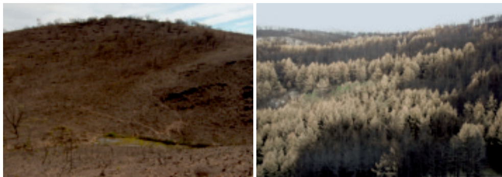
Figura 4. A la izquierda, incendio de Minas de Riotinto (Huelva, 2004); fotografía: Lorena M. Zavala. A la derecha, incendio en una plantación de pinos de Teruel (julio de 2009).

denado al fracaso si no se reúnen las condiciones apropiadas en el suelo. Este hecho es olvidado por técnicos, gestores, científicos y, lamentablemente, estudiantes. Por esta razón, hay quien se ha preguntado: “¿dónde está la inconexión?”, dando algunas respuestas “para que pensemos por un momento si no le estamos haciendo un flaco favor a la sociedad, y al medio ambiente por cuya mejora investigamos. Debemos reconectarnos con la sociedad, para que la triada que ha hecho evolucionar a la ciencia durante siglos, vuelva a funcionar en nuestro campo” (Ruiz-Gallardo, 2010). Por ello, el objetivo de la publicación de este libro es llevar a cabo la actualización de métodos y técnicas para el estudio de los suelos afectados por incendios forestales, para mostrar cómo y en qué trabaja la comunidad científica y proporcionar una herramienta válida para que sea empleada también por otros.